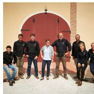
Das deutsch-italienische Campo alla Sughera-Team

Das Pionier-Weingut Campo alla Sughera wurde von Beginn an mit einem klaren Ziel vor Augen gegründet: durch Forschung, Expertise und innovative technische Lösungen sollten herausragende Weine geschaffen werden. Darunter der beste Bolgheri Rosso DOC – reich an Struktur, Terroir und Komplexität. So wurde dieses «Qualitätsprojekt» geboren und mit Unterstützung von professionellen Branchen-Partnern vorangetrieben – ausgehend vom Weinberg über die Kellerei bis hin zum fertigen Produkt.