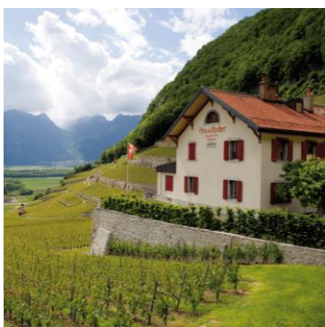
Weingut Clos du Roche

Gegründet wurde Cottinelli 1868 als kleines italienisches Kolonialwarenlädeli in Chur. Im Italienerlädeli standen immer mehr Weine im Regal neben den Alimentari. Irgendwann beschäftigte man sich dann nur noch mit Wein. Das Weinhaus Cottinelli entstand. In den 1970ern erfolgte dann der Umzug nach Malans. Die intensiven Anstrengungen zur Qualitätssteigerung im Rebbau geben Cottinelli recht; die Qualität eines Weines beginnt bereits im Rebberg. Der schonende Umgang mit den natürlichen Ressourcen und eine konsequente Umsetzung der Absichten zu einer naturnahen, integrierten Produktion bringen die Cottinelli-Weine von Jahr zu Jahr auf einen neuen Höchststand.