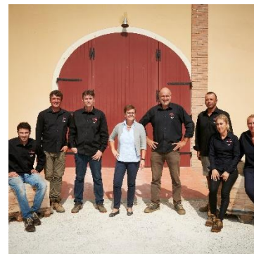
Das deutsch-italienische Campo alla Sughera-Team

Das Pionier-Weingut Campo alla Sughera wurde von Beginn an mit einem klaren Ziel vor Augen gegründet: durch Forschung, Expertise und innovative technische Lösungen sollten herausragende Weine geschaffen werden. Darunter der beste Bolgheri Rosso DOC – reich an Struktur, Terroir und Komplexität. So wurde dieses «Qualitätsprojekt» geboren und mit Unterstützung von professionellen Branchen-Partnern vorangetrieben – ausgehend vom Weinberg über die Kellerei bis hin zum fertigen Produkt.