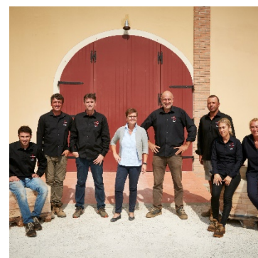
Das deutsch-italienische Campo alla Sughera-Team

Das Pionier-Weingut Campo alla Sughera wurde von Beginn an mit einem klaren Ziel vor Augen gegründet: durch Forschung, Expertise und innovative technische Lösungen sollten herausragende Weine geschaffen werden. Darunter der beste Bolgheri Rosso DOC – reich an Struktur, Terroir und Komplexität. So wurde dieses «Qualitätsprojekt» geboren und mit Unterstützung von professionellen Branchen-Partnern vorangetrieben – ausgehend vom Weinberg über die Kellerei bis hin zum fertigen Produkt.