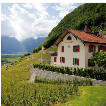
Weingut Clos du Roche

Gegründet wurde Cottinelli 1868 als kleines italienisches Kolonialwarenlädeli in Chur. Im Italienerlädeli standen immer mehr Weine im Regal neben den Alimentari. Irgendwann beschäftigte man sich dann nur noch mit Wein. Das Weinhaus Cottinelli entstand. In den 1970ern erfolgte dann der Umzug nach Malans. Die intensiven Anstrengungen zur Qualitätssteigerung im Rebbau geben Cottinelli recht; die Qualität eines Weines beginnt bereits im Rebberg. Der schonende Umgang mit den natürlichen Ressourcen und eine konsequente Umsetzung der Absichten zu einer naturnahen, integrierten Produktion bringen die Cottinelli-Weine von Jahr zu Jahr auf einen neuen Höchststand.